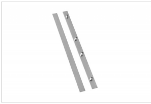
Extension Set Eco/Simple