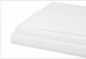
Therm Acoustic FK-8930