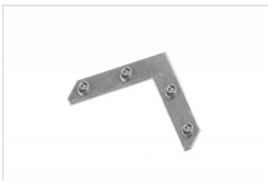
Lockset Simple Large Single Plate FK-0214B