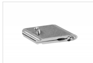
Lockset Stabilizer 45° FK-0222