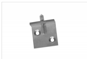
Wall Mount Heavy FK-0410