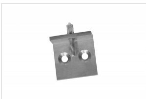
Wall Mount Simple FK-0400