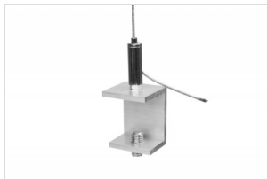
Ceiling Mount Slim Suspension FK-0422