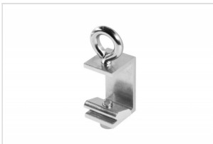
Ceiling Mount Slim FK-0420