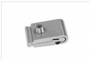
Lockset Stabilizer FK-0220